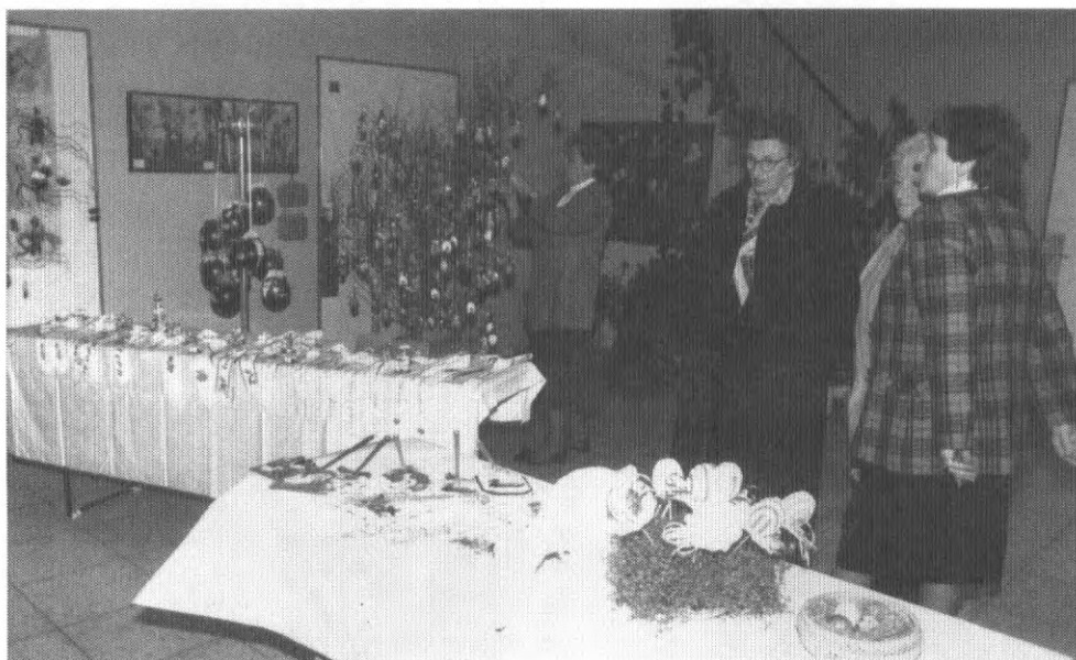
Auf dem Osterbasar kann man alles finden, vom praktischen Eierwärmer bis zu den schönsten Blumengestecken und Kränzen. Alles haben die Theilheimer Frauen für diesen Anlaß gefertigt.