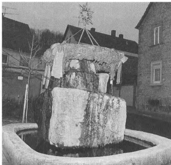
Hier sehen wir den Brunnen mit einem großen Adventskranz geschmückt.